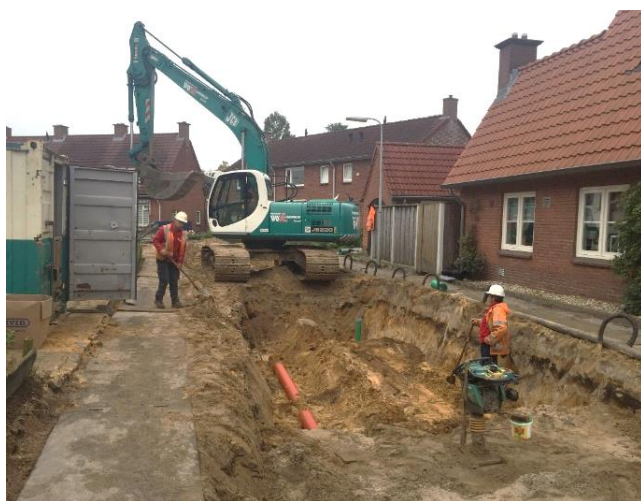
Figuur 2, rioleringswerkzaamheden in de Julianastraat.

Het vuilwaterriool is tot aan de kruising Julianastraat - Willem-Alexanderweg vervangen. Ook het nieuwe infiltratieriool is gerealiseerd tot aan dit punt. Donderdag 21 september zijn de stratenmakers gestart met het aanbrengen van de nieuwe voetpaden van de Julianastraat en zijn de eerste contouren van de nieuwe weg al goed zichtbaar. Vanaf de Emmastraat zijn wij gestart met het aanbrengen van de afwateringsgoot en de rijbaan.