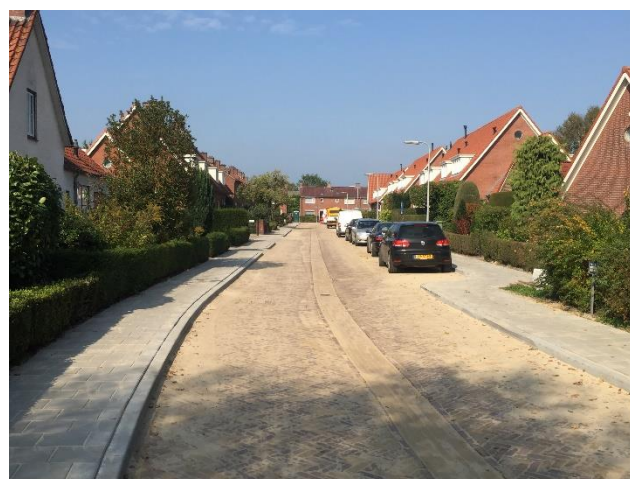
Figuur 1, De Wilhelminastraat maandag 25 september.

De afgelopen maand zijn wij bezig geweest met de werkzaamheden in de Wilhelminastraat en de Julianastraat. De werkzaamheden in de Emmastraat zijn vlak voor onze bouwvak vakantie afgerond. Tevens is voor de bouwvak ook nog het vuilwater- en infiltratieriool in het eerste gedeelte van de Wilhelminastraat aangebracht. Na de bouwvak is het riool in het laatste gedeelte van de Wilhelminastraat gerealiseerd en is de nieuwe bestrating aangebracht. Afgelopen vrijdag, 22 september, zijn deze werkzaamheden volgens planning afgerond en is het wegvak weer opengesteld voor verkeer.